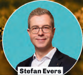
Stefan Evers Bürgermeister von Berlin Senator für Finanzen, Kultur und Gesellschaftlichen Zusammenhalt