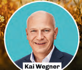
Kai Wegner Regierender Bürgermeister von Berlin